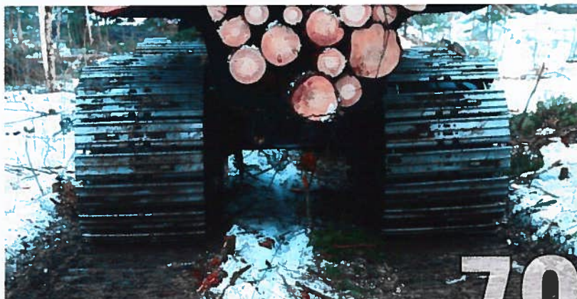
Kunderna har även provat KOPA-banden vintertid och berättat att de packar snön så att den blir bärande under skogsmaskinen