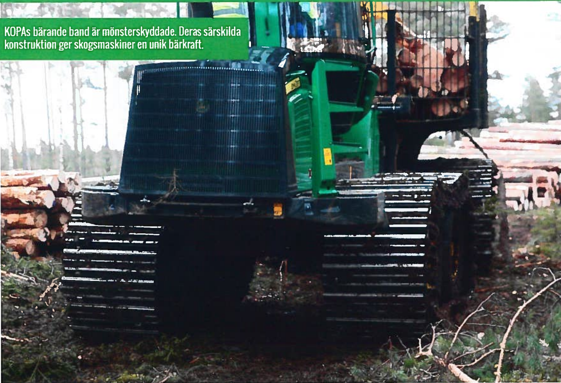
KOPAs bärande band är mönsterskyddade. Deras särskilda konstruktion ger skogsmaskiner en unik bärkraft.