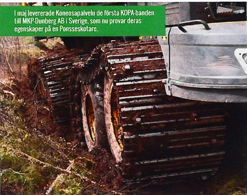
I maj levererade Koneosapalvelu de första KOPA-banden till MKP-Dunberg AB i Sverige, som nu provar deras egenskaper på en Ponsse-kotare.